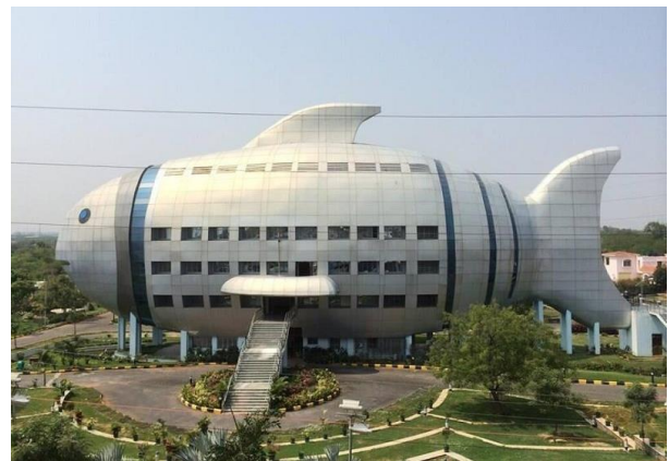
En arbetsplats och ett kontor jag tyvärr missat, här National Fisheries Development Board, nära Hyderabad, Indien

Nu har många fiskevårdsområdesföreningar sina årsstämmor. Många föreningar har fått fin snurr på fiskekortförsäljningen. När pengarna börjar samlas på hög är frågan vad man då gör med dessa. I stadgarna står det att man ska ha en fiskevårdsplan, men vad är egentligen det? Självklart ska fisket vårdas, men frågan är hur man gör det på bästa sätt. Vad behövs, hur gör man, ska man fokusera på intäkter, medlemsutdelning, vårda fiskarna, sätta ut mer fisk, eller vad? En bra start är ju att genomföra ett provfiske, med el i rinnande vatten och med speciella provfiske nätt i sjöar. I höstas hjälpte vi en medelstor fvf att själva genomföra ett nätprovfiske, vi bistod med kunskaper, redskap, instruktioner och bearbetning. I år har man en rapport att visa på stämman, i detta fall