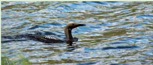
Storlommen häckar i Pickesjön