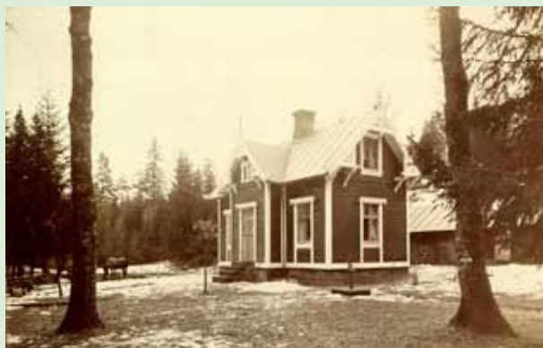
Picke 1914

Gården finns nämnd 1574. Gårdens ursprungliga läge var fram till slutet på 1800-talet cirka 100 m norr om P-platsen vid dammfästet. Fastigheten köptes av Borås Stad 1899. Det nya huset låg bakom parkeringen vid dammfästet. I början av 1900-talet bodde stadens "vattenmästare" här. Huset var bebott till 1952 och revs i början av 1970-talet.