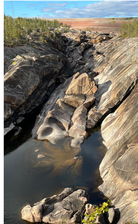
Kraftverksdamm i bakgrunden med torrfåra nedanför.

Jag åkte till Lappland i september, fantastiska färger och fantastiskt väder. Ett besök var till Stora Sjöfallet, helt fantastiskt, även om vattenflödet bara egentligen numera är en rännil mot förr, innan vattenkraften tog stora delar av vattnet. Även stora kraftverksdammar, och påföljande torrfåror utgör svensk nutidshistoria. En gruva klämdes också in, där mycket av de metaller utvinns som vi bland annat behöver i våra elbilar. Och det är när man ser allt detta som man tänker att ens egen miljöinsats att skaffa elbil, faktiskt har en mycket uppenbar baksida, om man väljer att titta på miljöeffekterna!