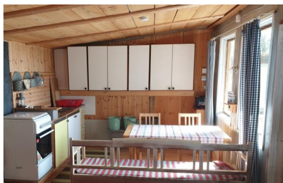
Laga mat och äta (ovan) Sova i kojan (nedan)