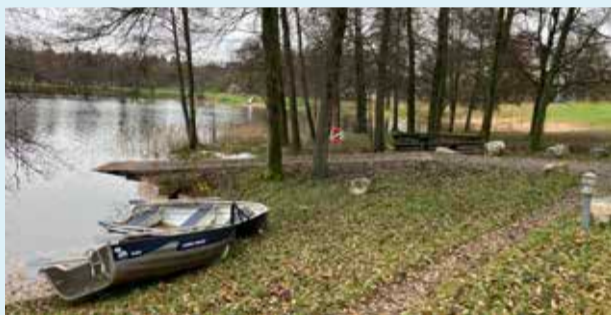
Hyrbåtarna och båtrampen vid Almenäs.