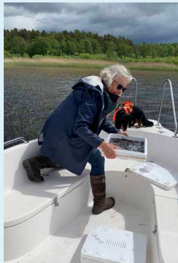
Utsättning av ålyngel.

Kontrollavgift (1 000 kr) tas ut om bestämmelserna inte följs.