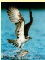
Fiskgjuse (Osprey / Fischadler)