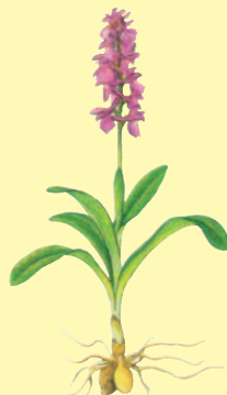
Sankt Pers nycklar (Early-purple Orchid / Grosses Knabenkraut)

Avgnagda trädstubbar och rishyddor skvallrar om kanalsystemets livskraftiga bäverstam. Bland fåglarna märks storlom och fiskgjuse som häckar i Ånimmen. Även smålommen besöker ofta området från närbelägna häcklokaler. Strömstaren är en regelbunden övervintrare.