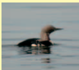
Storlom (Black-throated Diver / Prachtaucher)

Stränderna längs Ånimmen och Dalslands kanal är kända för sin rika flora och omnämndes redan av Carl von Linné. Den kalkrika berggrunden gynnar många orkidéer, bland annat brudsporrar och Sankt Pers nycklar. Alla orkidéer är fridlysta.